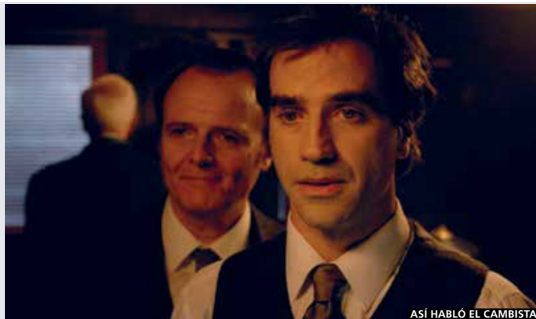
ASÍ HABLÓ EL CAMBISTA