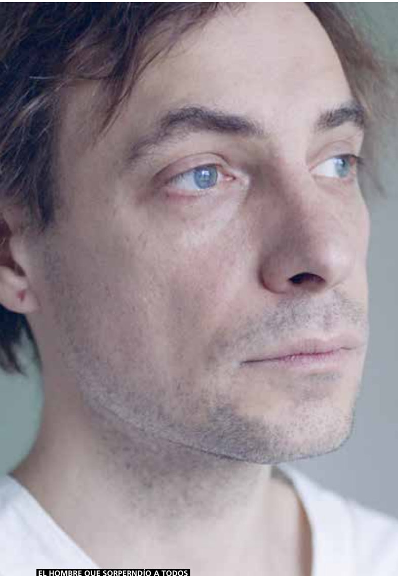
EL HOMBRE QUE SORPRENDIÓ A TODOS

Medel ” según justificación del jurado de la Competencia Internacional.