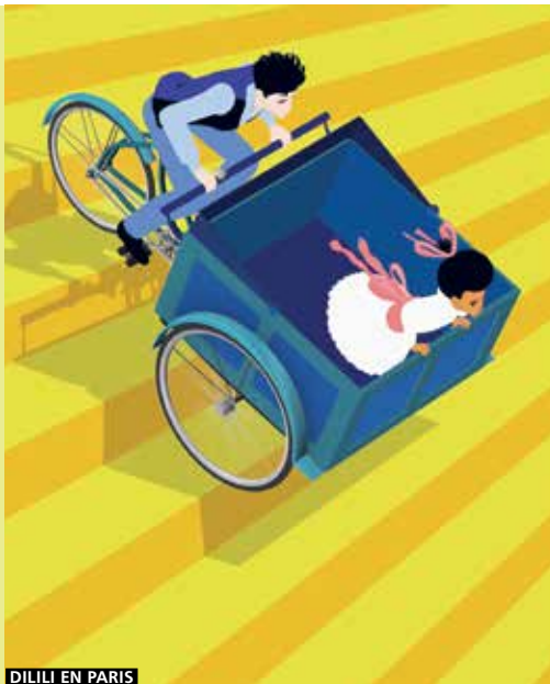
DILILI EN PARÍS