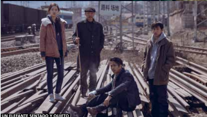
UN ELEFANTE SENTADO Y QUIETO