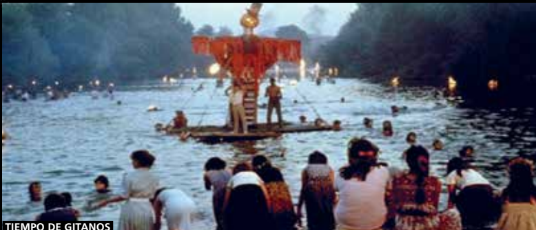
TIEMPO DE GITANOS