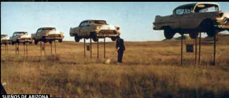
SUEÑOS DE ARIZONA

En un extraño y desolador paraje del desierto americano, un vendedor de coches convence a su sobrino para que trabaje con él. Allí conocerá a una mujer que le traerá serios problemas. En su primer film "norteameri-