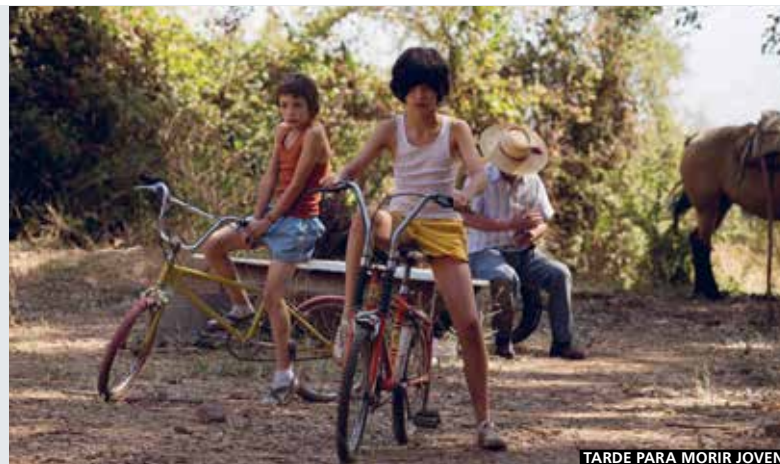
TARDE PARA MORIR JOVEN