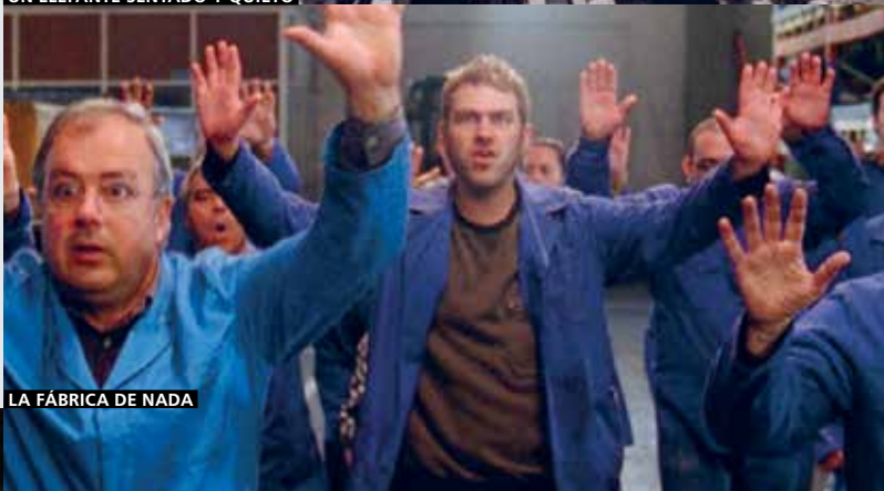
LA FÁBRICA DE NADA

Cuatro historias de personas desventuradas, historias comunes que el destino va entrelazando por una leve empatía que parece ser la única oportunidad de luz en una sociedad deshumanizada, en una ciudad en la que el tiempo parece no avanzar y donde quienes deberían proteger a los demás, no lo hacen. El joven director y libretista chino Hu Bo, trágicamente suicidado poco después de haber terminado esta película, construye una obra maestra que se mete en la esencia de la vida.