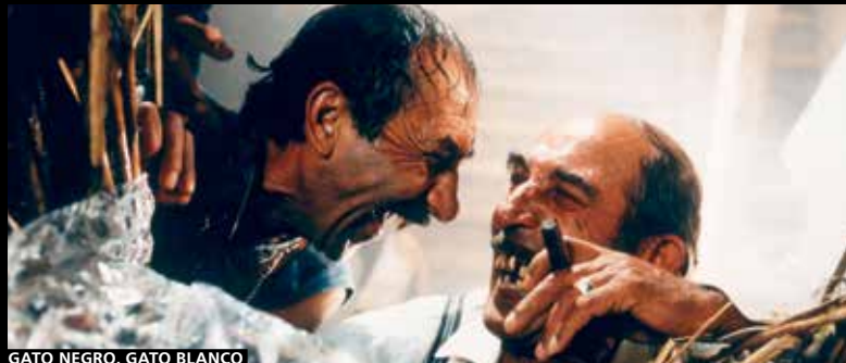
GATO NEGRO, GATO BLANCO

cando mejores condiciones de trabajo. El experimento americano no funcionó para el director, que volvió a sus raíces (y a ganar la Palma de Oro) con Underground , que abordaba el tema de los Balcanes, medio siglo de desencuentros después de la Segunda Guerra Mundial, para volver a los gitanos en una clave entre costumbrista y con toques de realismo mágico en Gato negro, gato blanco .