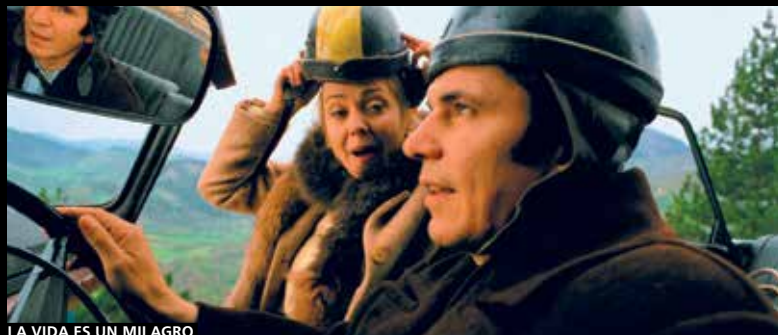
LA VIDA ES UN MILAGRO