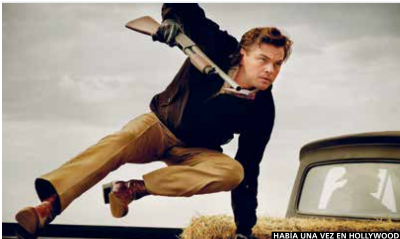
HABÍA UNA VEZ EN HOLLYWOOD