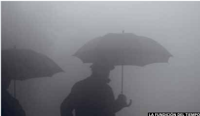
LA FUNDICIÓN DEL TIEMPO