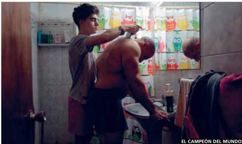
EL CAMPEÓN DEL MUNDO