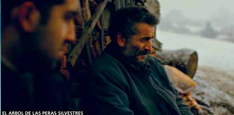
EL ÁRBOL DE LAS PERAS SILVESTRES