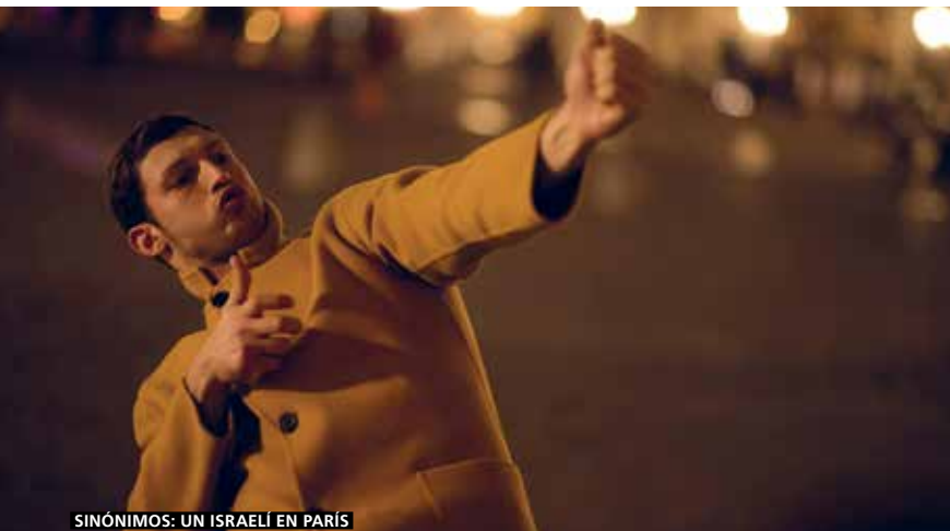
SINÓNIMOS: UN ISRAELÍ EN PARÍS