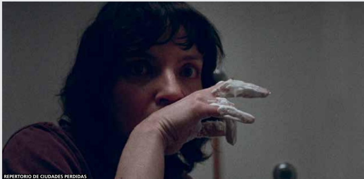
REPERTORIO DE CIUDADES PERDIDAS

Desde 2005 Denis Côté , nacido en Perth-Andover, Canadá, en 1973, se ha labrado una sólida reputación como cineasta independiente, tanto en Quebec como a nivel internacional. Tras dirigir numerosos cortometrajes y trabajar durante unos cuantos años como periodista y crítico de cine, debutó en el largometraje con Les états mordi-ques (2005). En su filmografía, en la que hay espacio para la ficción y el documental, destacan títulos como Cur-ling (2010), que recibió los premios al